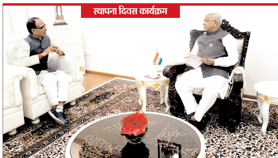
स्थापना दिवस कार्यक्रम

मेडिकल और इंजीनियरिंग की पढ़ाई के लिए उनकी फ्रीस सरकार भरेगी। प्रदेश में इस वर्ष एक लाख लोगों को सरकारी नौकरी दी जाएगी। स्व-रोजगार योजनाओं के माध्यम से भी युवाओं को रोजगार का अवसर दिया जाएगा। मुख्यमंत्री ने कहा कि विन्ध्य क्षेत्र के किसान गेहूँ तथा धान उत्पादन में रिकार्ड बना रहे हैं। यहाँ के किसान पंजाब को भी कुछ दिनों में मात दे देंगे। खेती के विकास के लिए सिंचाई सुविधा होना आवश्यक है। नईगाड़ी लिफ्ट एरिगेशन का कार्य तेजी से पूरा किया जाएगा। जिले के अन्य क्षेत्रों में सर्वेक्षण कर वहाँ बाणसागर की नहर पहुँचाने का प्रयास होगा। मुख्यमंत्री श्री चौहान ने देवतालाब के प्रसिद्ध शिव मंदिर में पूजा-अर्चना कर प्रदेश के विकास के लिए आशीर्वाद माँगा।