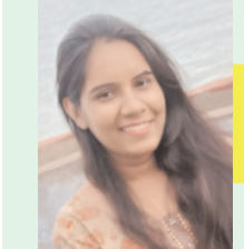
लेखक- वैशाली नारनवरे, छिंदवाड़ा

बारिश की बूंदों का अफसाना, बादल गरजा फिर देखा वो नजराना।।