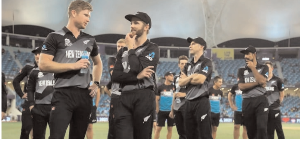
वेलिंग्टन

भारत के खिलाफ तीन मैचों की टी20 और वनडे सीरीज के लिए न्यूजीलैंड की टीम का एलान हो गया है। न्यूजीलैंड क्रिकेट बोर्ड ने सीनियर ओपनर मार्टिन गुप्टिल और दिग्गज तेज गेंदबाज ट्रेट बोल्ट को टीम से बाहर कर दिया है। वहीं, उनकी जगह फिन एलेन ही अब दोनों फॉर्मेट में टीम के लिए ओपनिंग करते दिखेंगे। भारतीय टीम न्यूजीलैंड दौरे पर तीन मैचों की टी20 और वनडे सीरीज खेलेगी, जिसकी शुरुआत 18 नवंबर से हो रही है। न्यूजीलैंड क्रिकेट बोर्ड ने दोनों सीरीज के लिए 13-13 खिलाड़ियों की टीम घोषित की है। केन विलियम्स दोनों टीमों की कप्तानी करते दिखेंगे। वहीं, टीम बुधवार को ट्रेनिंग के लिए वेलिंग्टन पहुंच जाएगी। 23 साल के