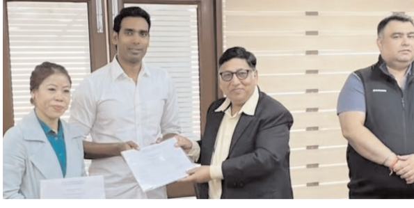
एजेंसी □ नई दिल्ली

भारतीय ओलंपिक संघ ने दिग्गज महिला मुक्केबाज मैरीकॉम को आईओए की एथलीट्स कमिशन का अध्यक्ष चुना है। सर्वसम्मति से इस पद के लिए चुनी गईं। वहीं, राष्ट्रमंडल खेलों के स्वर्ण पदक विजेता टेबल टेनिस खिलाड़ी अचंत शरत कमल उपाध्यक्ष चुने गए। मैरीकॉम आठ बार की वर्ल्ड चैंपियनशिप मेडलिस्ट रह चुकी हैं। वह वर्ल्ड चैंपियनशिप में छह बार (2002, 2005, 2006, 2008, 2010, 2018) स्वर्ण पदक जीत चुकी हैं। वहीं, 2012 लंदन ओलंपिक में मैरीकॉम ने कांस्य पदक जीता था। मैरीकॉम दो बार की एशियन गेम्स मेडलिस्ट भी रह चुकी हैं। 2014 इंचियन एशियन गेम्स में मैरीकॉम ने स्वर्ण और 2010 ग्वांग्यू एशियन गेम्स में कांस्य जीता था। वह 2018 कॉमनवेल्थ गेम्स में स्वर्ण पदक भी जीत चुकी हैं। वहीं, शरत राष्ट्रमंडल खेलों में भारत के सबसे सफल एथलीट्स के मामले में तीसरे स्थान पर हैं। उनसे ज्यादा सिर्फ जसपाल राणा (शूटिंग) और समरेश जंग (शूटिंग) ने पदक जीते हैं। जसपाल के नाम राष्ट्रमंडल खेलों में 15 पदक (9 स्वर्ण) और समरेश के नाम 14 पदक (7 स्वर्ण) हैं।