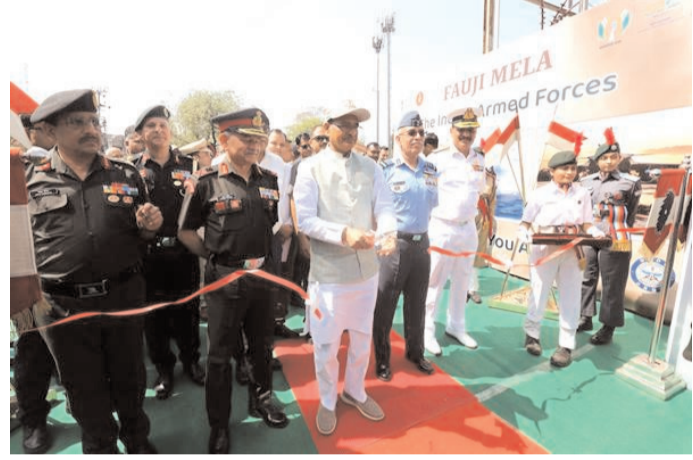
आजादी के बाद शहीद हुए 30 हजार जवानों की स्मृति में बनाया है भोपाल का शौर्य स्मारक

भोपाल। मुख्यमंत्री श्री शिवराज सिंह चौहान ने कहा है कि नवरात्रि का पावन पर्व शक्ति की उपासना का पर्व है। मध्य प्रदेश और भोपाल का सौभाग्य है कि नवरात्रि में फौजी मेला और शस्त्र प्रदर्शनी से हमें शक्ति की आराधना का अवसर प्राप्त हुआ है। मैं प्रधानमंत्री श्री नरेंद्र मोदी तथा केन्द्र सरकार द्वारा भोपाल में फौजी मेला आयोजित करने के लिए आभारी हूँ। मुख्यमंत्री ने कहा कि भारत वर्ष का हजारों साल लम्बा ज्ञात इतिहास रहा है। हमारा शौर्य और वीरता भी हजारों वर्षों से स्थापित है। भारत के विचार, संस्कार, संस्कृति ने विश्व को दिशा दिखाई है। यदि हम शक्तिहीन हैं तो कोई हमारी बात नहीं सुनता है। भारत की सेना विश्व की सबसे अधिक सक्षम सेनाओं में से एक है। हमारे जवान कठिनतम परिस्थितियों में रह कर माँ भारती की रक्षा कर रहे हैं। सेना के त्याग, तपस्या के परिणामस्वरूप ही हम