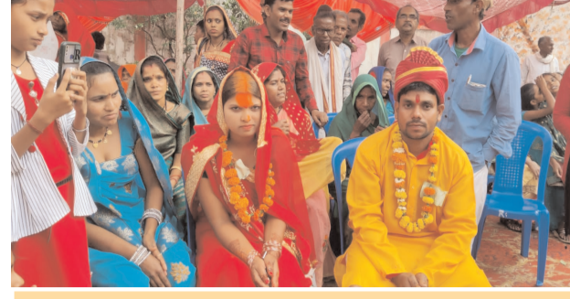
इंडोर स्टेडियम धनपुरी में आयोजित सामूहिक विवाह में 198 जोड़े बंधे परिणय सूत्र में

लिये वहीं मुस्लिम समाज के 3 जोड़े ने पवित्र कुरान की अयातों के साथ निकाह के पवित्र गठबंधन में बंधे। सामूहिक विवाह कार्यक्रम में जिला प्रशासन के अधिकारियों एवं जनप्रतिनिधियों ने ढोल धमाके के साथ बारात की अगवानी की