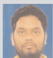
Poetry / By R.Surya

जो मेरे दिल में तड़प है कुछ करने की ललक है सोने में जो दहक है अब, वक्त आ गया है खुद को जगाने का खुद को खुद से पहचान कराने का बचपन से देखा है, जो ख्वाब लक्ष्य को पाने की चाहत है अब तो रास्ते में चलना ही पड़ेगा कुछ भी हो जाये, तेरे साथ जीना ही पड़ेगा अब, वक्त आ गया है खुद को जगाने का खुद को खुद से पहचान कराने का बावरा हो गया हूँ, तुझको पाने के लिए ऐ मजिल, आवारा हो गया हूँ बंजारा बनके फिरता हूँ, मन मेरा मुसाफिर की तरह दूढ़ता है, दिल मेरा मरने से पहले तुझको पाना है जिन्दगी अब सिर्फ तेरे लिए ही जीना है अब, वक्त आ गया है खुद को जगाने का खुद को खुद से पहचान कराने का लोग ताने मारेंगे, असफल मिलेंगे तो जिन्दगी भर कोसेंगे और सफलता मिलेगी, तो ताली मारेंगे परवाह नहीं है मुझे ऐसी बातों की, किसी के ताने का कुछ कर गुजरना है तो जोखिम तो उठाना ही पड़ेगा जो टान लिया है तो खुद को जगाना ही पड़ेगा अब, वक्त आ गया है खुद को जगाने का खुद को खुद से पहचान कराने का