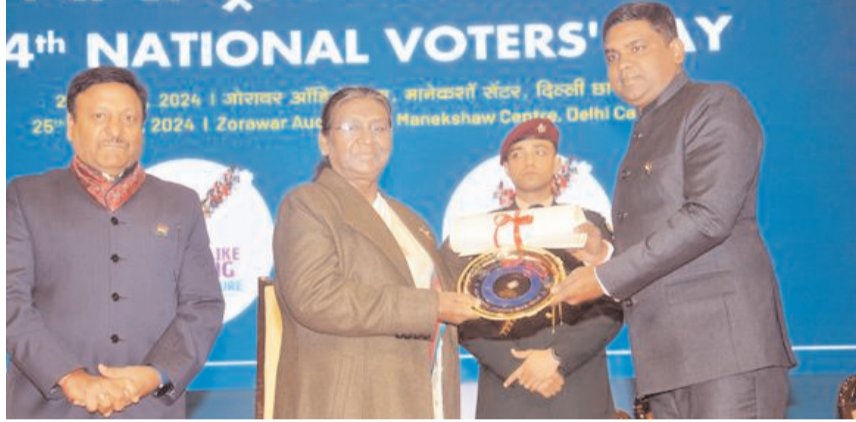
भोपाल। भारत निर्वाचन आयोग ने निवाड़ी जिला पंचायत के मुख्य कार्यपालक अधिकारी

राष्ट्रपति श्रीमती मुर्मू ने राष्ट्रीय मतदाता दिवस पर किया सम्मानित