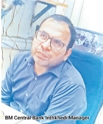
BM Central Bank Intkhedi Manager