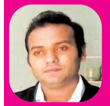
युवा प्रदेश समाचार पत्र

- अजमानतीय अपराध- ऐसे अपराध जिनमें जमानत का प्रावधान नहीं होता है, लेकिन न्यायालय को लगता है कि अपराध करने वाले व्यक्ति के खिलाफ कोई ठोस साक्ष्य एवं तथ्य साबित नहीं हो पा रहे हैं तब न्यायालय अजमानतीय अपराध में भी आरोपी को जमानत दे सकता है।