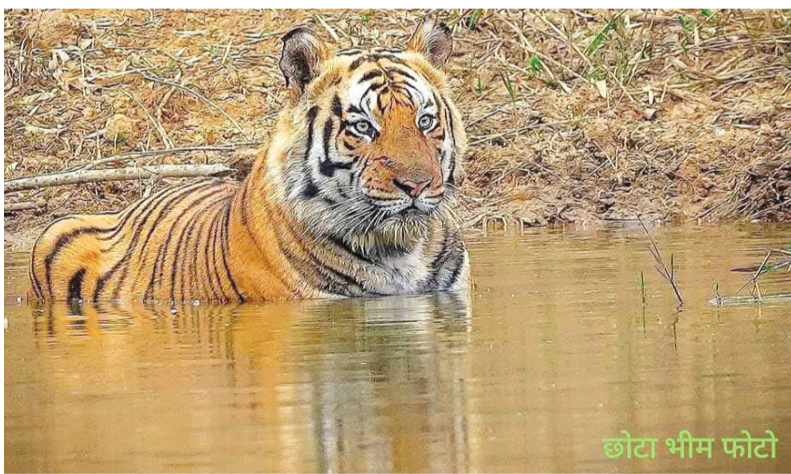
छोटा भीम फोटो

रिपोर्टर देवेन्द्र कुमार जैन भोपाल मध्य प्रदेश